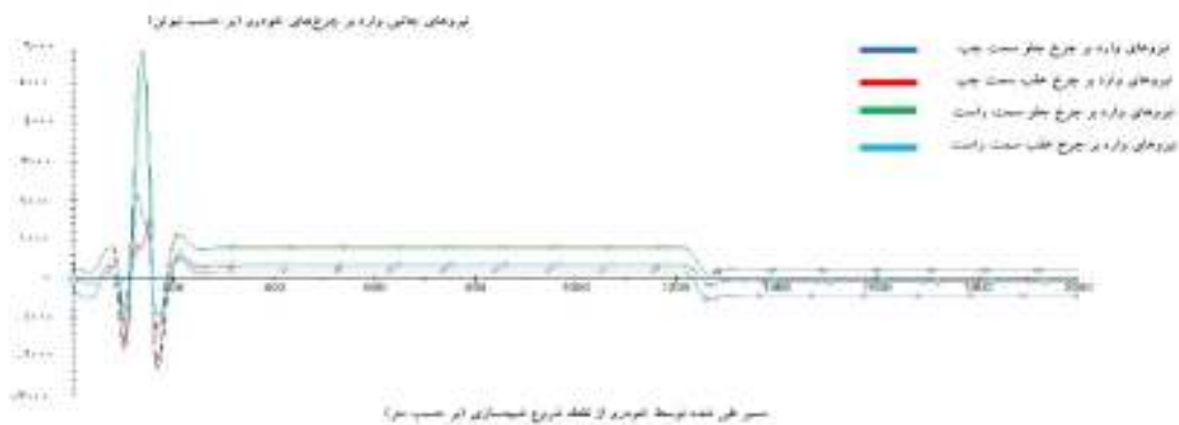
(الف) - نمودار نیروهای جانبی وارد بر چرخ‌های خودرو سواری شاسی‌بلند در نقاط مختلف مسیر شبیه‌سازی شده