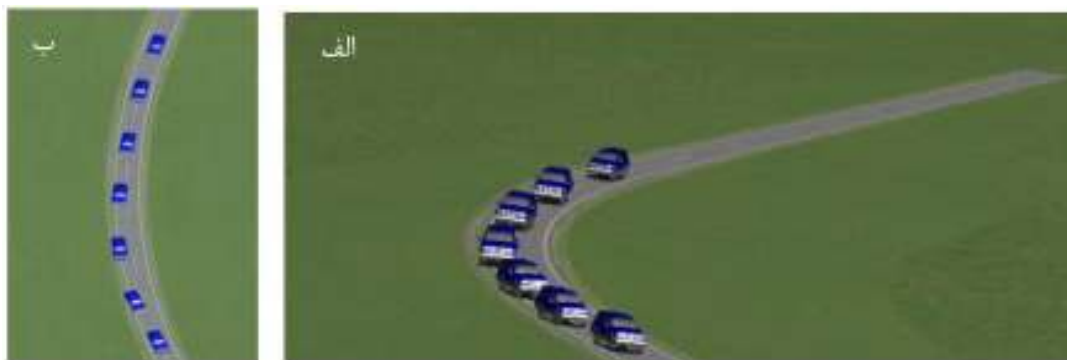
شکل ۱. شبیه‌سازی خروج از قوس و فرارگیری چرخ‌های خارجی خودرو روی شانه در قوس افقی در پژوهش جاری (الف- نمای کلی) و (ب- نمای هوایی)

همین مکان اطلاعات نرخ زاویه واژگونی قرائت می‌گردد. نمونه‌ای از نمودارهای تغییرات نیروی جانبی و نرخ زاویه واژگونی در مسیر برای خودرو سواری شاسی‌بلند در نرم‌افزار شبیه‌سازی دینامیک خودرو در شکل (۲) نشان داده شده است. در ادامه این تحقیق و در جدول‌های (۳) و (۴) ارتباط