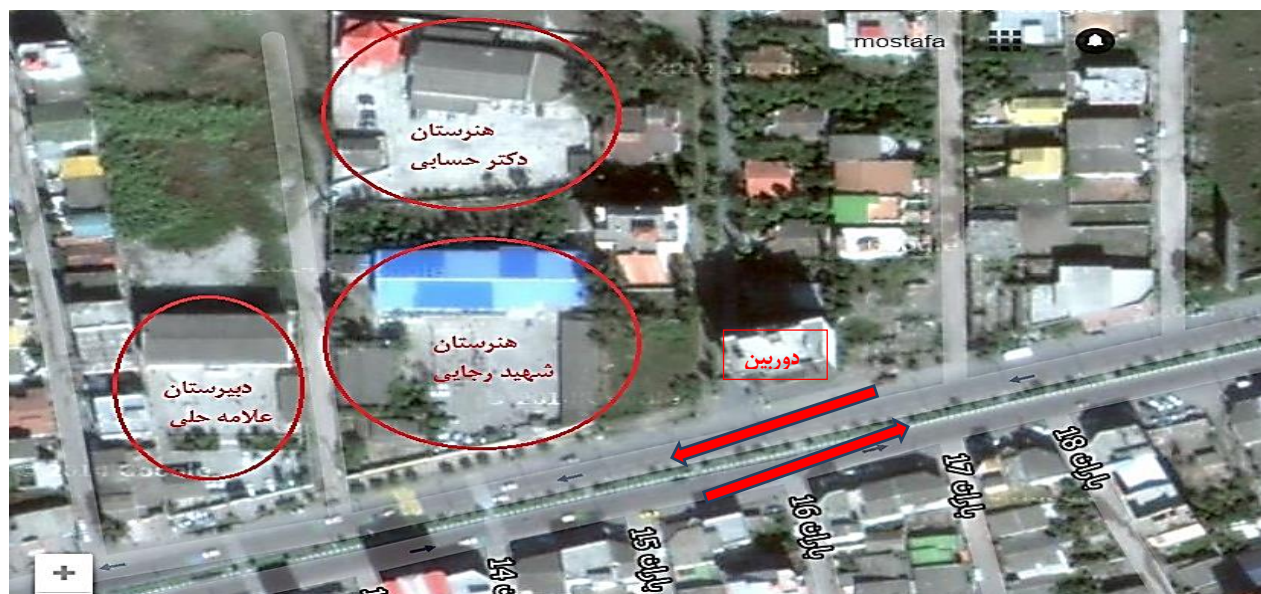
شکل 1. محدوده مورد بررسی در گوگل ارت