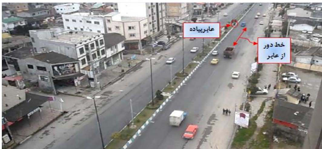
شکل 3. مثال مدل احتمال عبور