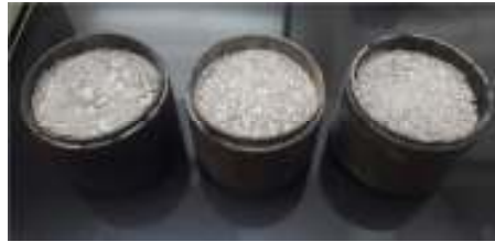
شکل ۲. نمونه های اساس متراکم پیش از آزمایش نفوذپذیری

به منظور تعیین انرژی تراکم ساخت نمونه های اساس، نمونه های متعدد با انرژی تراکمی متفاوت ساخته شدند و نفوذپذیری امولسیون بدون حلال درون آنها ارزیابی شد. انرژی تراکم برابر با ۱۰ ضربه چکش مارشال در هر لایه به نحوی انتخاب شد که زمان نفوذ امولسیون در لایه اساس متراکم کمتر