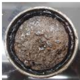
امولسیون حاوی حلال