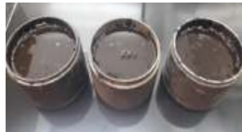
شکل ۳. نمونه های اساس متراکم در آزمایش نفوذپذیری امولسیون