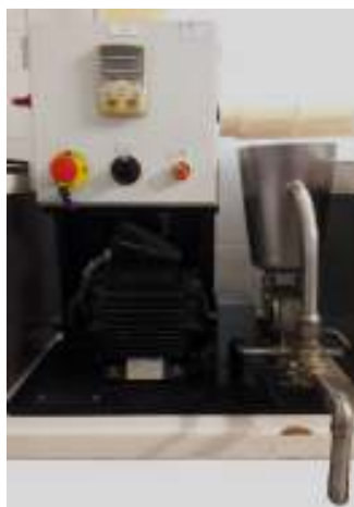
شکل ۱. دستگاه امولسیون ساز آزمایشگاهی