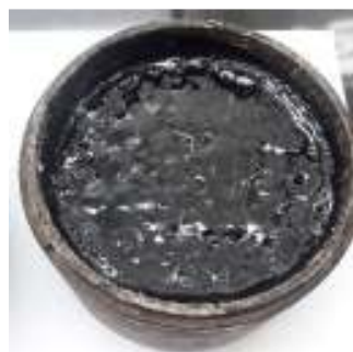
امولسیون بدون حلال

مقایسه نتایج آزمایش نفوذ امولسیون‌های حاوی حلال بیولوژیکی و نفت سفید نشان می‌دهد که حلال نفت سفید مقدار سرعت نفوذ امولسیون در اساس متراکم را بیش از حلال بیولوژیکی افزایش داده است. با وجود اینکه نتایج حاصل برای نفت سفید بهتر از حلال بیولوژیکی است، حلال بیولوژیکی نتایج قابل قبولی دارد و با توجه به مزایای زیست محیطی آن جایگزینی مناسب برای حلال‌های نفتی است. همچنین مقایسه نتایج مربوط به نمونه‌های اساس خشک و مرطوب نشان داد که نفوذ امولسیون در لایه اساس مرطوب سریعتر از اساس خشک بوده و رطوبت مصالح اساس متراکم منجر به افزایش نفوذ امولسیون دیرشکن در لایه خاکی متراکم می‌شود. بررسی آزمون‌های نمونه‌های اساس خشک و اساس مرطوب در امولسیون‌های با مقدار حلال متفاوت نشان می‌دهد که افزایش