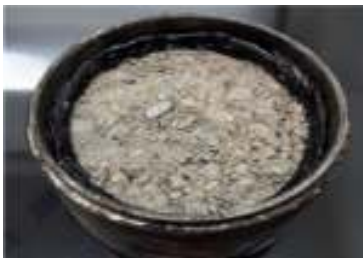
شکل ۴. آب بندی فاصله میان دیواره قالب و مخلوط مصالح اساس

برای آزمایش نفوذپذیری نمونه های اساس متراکم، قیرهای امولسیونی تا حدی که مقدار پسماند آنها برابر با ۴۰ درصد گردد، توسط آب رقیق شدند و به مقدار یکنواخت ۰/۵ گرم بر سانتیمترمربع بر روی نمونه های اساس پاشیده شدند. بلافاصله پس از پاشش امولسیون ها همانطور که در شکل ۳ نشان داده شده است، زمان شروع نفوذ ثبت شده و مدت زمان نفوذ کامل امولسیون به درون اساس متراکم تعیین گردید. مشابه شکل ۴، جداره قالب های نمونه در محل تماس با مخلوط مصالح اساس با استفاده از قیر داغ آب بندی شد تا پس از پاشش امولسیون و شروع نفوذ، قیر امولسیونی از فاصله میان مخلوط و جداره قالب نفوذ نکرده و خطای آزمایش کمینه شود. جهت ارزیابی اثرات رطوبت مخلوط مصالح اساس بر زمان و مقدار نفوذ امولسیون اندود نفوذی، آزمایش نفوذپذیری