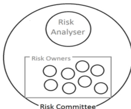
شکل ۱. "ارتباط بین تحلیلگر ریسک و مالکان ریسک"

استاندارد ایزو "10006:2003" چنین می‌گوید که مدیریت ریسک‌های پروژه با عدم قطعیت‌ها در سرتاسر پروژه سروکار دارد. این موضوع نیازمند یک رویکرد ساختار یافته است که بایستی در قالب طرح مدیریت ریسک مدون شود. هدف فرایندهای مرتبط با ریسک حداقل کردن رخدادهای منفی بالقوه و استفاده حداکثر از فرصت‌ها برای بهبود می‌باشد. همچنین عدم قطعیت‌ها به فرایندهای پروژه یا محصول پروژه مرتبط می‌شود. فرایندهای مرتبط با ریسک عبارتند از: -شناسایی ریسک-ارزیابی ریسک-رفتار ریسک-ریسک کنترل(ضیایی ۱۳۸۴). "نایجل" فرایند مدیریت ریسک پروژه را به مراحل: شناسایی منابع ریسک، تعیین کمیت اثرات آنها (ارزیابی و تحلیل